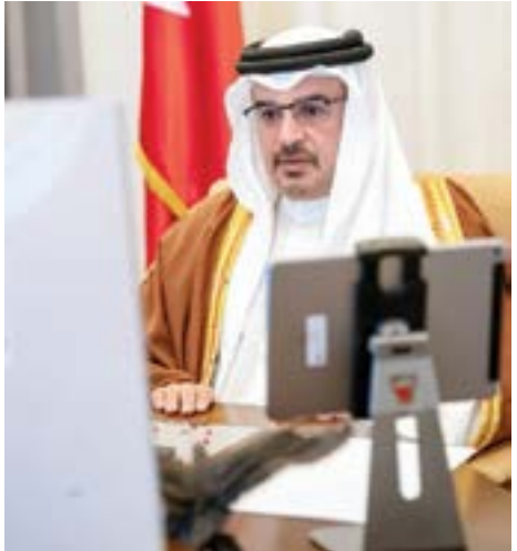
○ سمو ولي العهد يجلس جلسة مجلس الوزراء بعد.

استمراراً لتفكيك التوجهات الملكية السامية من خلال الحزمة المالية والاقتصادية لتخفيف عنكاسات جائحة فيروس كورونا على المواطنين والاقتصاد الوطني، ودعمًا للجهود الوطنية وفي إطار التعاون والتنسيق مع السلطة التشريعية، قررت الحكومة التكفل بفواتير الكهرباء والماء ورسوم البلديات لكل المشتركين المواطنين في مستحقاتهم الأول مدة ٣ أشهر ابتداءً من شهر أكتوبر ٢٠٢٠، بما لا يتجاوز فواتير الفترة نفسها من العام العاضى لكل مشترك. جاء ذلك خلال ترؤس صاحب السمو الملكي الأمير سلمان بن حمد آل خليفة ولي العهد نائب القائد الأعلى النائب الأول لرئيس مجلس الوزراء الاجتماع الاستراتيجي الأسبوعي لمجلس الوزراء. وأشاد مجلس الوزراء بالخطوة التاريخية المتمثلة في إعلان تأييد السلام مع دولة إسرائيل التي تؤكد نهج حضرة صاحب الجلالة الملك حمد بن عيسى آل خليفة عاهل البلاد المفدى في الالتزام