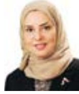
رئيسة مجلس النواب

أكدت رئيسة مجلس النواب فوزية زينل التعاون الفاعل مع الحكومة والتجاوب مع مطالبات النواب بشأن تخفيف الأعباء عن المواطنين في مواجهة تداعيات فيروس كورونا (كوفيد-19)، معربة عن بالغ الشكر وعظيم الامتنان للتوجهات السامية من حضرة صاحب الجلالة الملك حمد بن عيسى آل خليفة عاهل البلاد المفدى، وحرصه واهتمامه برعاية مصالح المواطنين ودعم وتوفير الاحتياجات اللازمة لهم، وهو الأمر الكريم الذي اعتاده المواطنون من الملك المفدى.