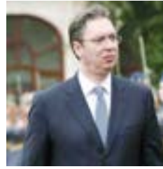
ألكسندر فوكوبراتوفيتش التعهدات للسلام، في الداخل والخارج. وأضاف: «كن مطمئناً، أيضا الصديق العزيز

أعلنت بلغراد عزمها إدراج «حزب الله» اللبناني في قائمة «المنظمات الإرهابية»، فيما اعتبر الرئيس الصربي، ألكسندر فوتشيتش، أن الخطوة تأتي في إطار «السير على خطى أسلافنا في مكافحة التهديدات للسلام داخليا وخارجيا»، وسير تويتهر رجب وزير الخارجية الأمريكي مايك بومبيو بالخطوة، معتبرا أن «إحجار مومبيو عمليات حزب الله في أوروبا تتساقط»، وقال: «إعلان صربيا بأنها ستدرج حزب الله في قائمة الإرهاب» يساعد في تقييد قدرة المنظمة الإرهابية على جمع الأموال والعمل في المنطقة». وأضاف: «خطوة عظيمة من قبل الرئيس الصربي ألكسندر فوتشيتش»، قائلا: «على خطى بيبوره عز» «فوتشيتش»، قائلا: «على خطى أسلافنا الكرام، تواصل صربيا الكفاح ضد جميع