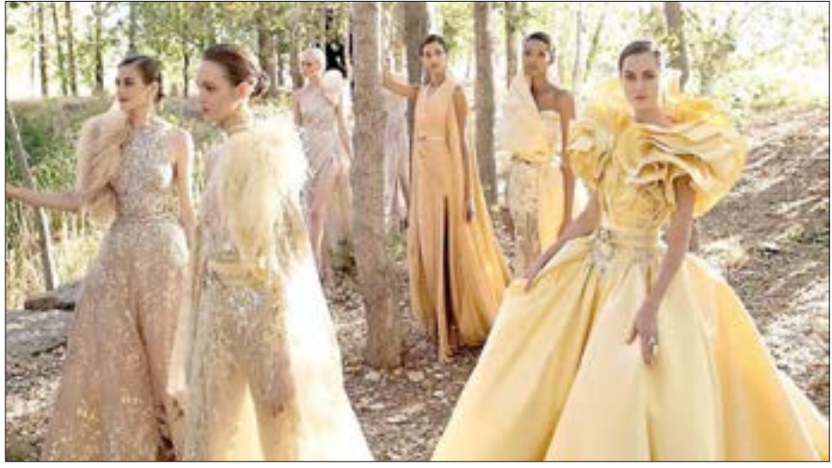
رسالة أمل وجهها الجسم اللبناني إلى صعب إلى مدينة بيروت المنكوبة بعد انفجار الرقأ، والرسالة اتخذت شكل فيديو تم نشره على صفحة المصمم في موقع إنستغرام، لجموعته من الأزباء الرافقة الخاصة بخريف 2020، والذي كان يقام عادة ضمن فعاليات أسبوع باريس للموضة لكن تم إلغاء عرضه المباشرة بسبب انتشار وباء كورونا.

1880 - افتتاح سكة الحديد بين ليفربول ومانشستر. 1864 - توقيع اتفاقية سبتمبر بين الحكومة الإيطالية وناپليون الثالث 1894 - اليابانيون يلحقون بالصين هزيمة عسكرية كبيرة في «معركة بينغ يانغ». 1916 - استخدام الديابات لأول مرة في التاريخ من قبل الجيش البريطاني في معركة السوم أثناء الحرب العالمية الأولى. 1928 - الطبيب البريطاني الكسندر فلمنج يكتشف البنسلين. 1963 - انتخاب أحمد بن بلة رئيساً للجزائر. 1974 - صدور مرسوم إنشاء وكالة المخابرات المركزية الأمريكية. 2009 - الإفراج عن الصحفي العراقي منتظر الزبيدي الذي اكتسب شهرة عالمية بعدما رشق الرئيس الأمريكي جورج دبليو بوش بحذائه. 2015 - محكمة الجنائيات الكويتية تقضي بإعدام سبعة أشخاص مدانين في قضية تفجير مسجد الإمام الصادق وتبرئ أربعة عشر آخرين. 2019 - فوز المنتخب الإسباني بنهائي بطولة كأس العالم لكرة السلة 2019 بعد تغلبه على المنتخب الأرجنتيني بنتيجة 75 - 95