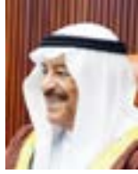
رئيس مجلس الشورى

جلالته على إصدار توجيهاته السامية للتخفيف من الأعباء على المواطنين. وأشاد رئيس مجلس الشورى بمتابعة الحكومة برئاسة صاحب السمو الملكي الأمير خليفة بن سلمان آل خليفة رئيس الوزراء، وبمساندة صاحب السمو الملكي الأمير سلمان بن حمد آل خليفة ولي العهد نائب القائد الأعلى النائب الأول لرئيس مجلس الوزراء، مؤكداً أن حرص الحكومة على مواصلة دعم المواطنين والمتضررين من الجائحة سيكون له الأثر البالغ في دعم الأسر البحرينية والمواطنين بشكل عام، وبما يحقق المزيد من الاستقرار المجتمعي. وأشار الصالح إلى أن البحرين اتخذت خطوات ريادية وغير مسبوقة باعتماد العزلة المالية والاقتصادية، ووضع برامج دعم استثنائية للمواطنين